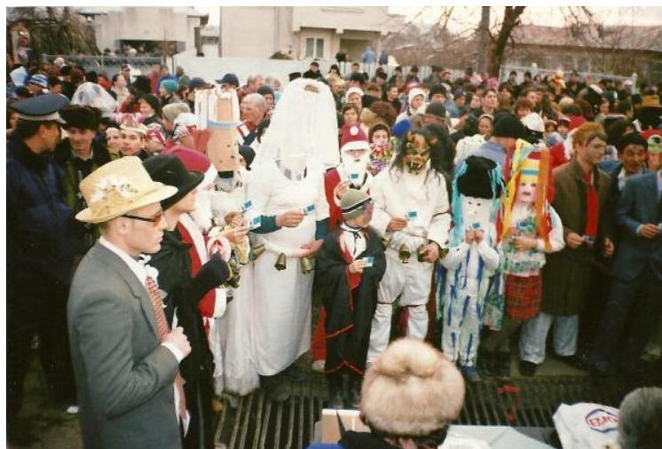
Fig.2. Personaje și măști rituale moderne (din arhiva personală de fotografii)