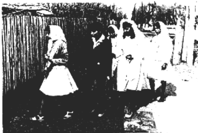
Lazăr în comuna Șoldanu, Ilfov

( Folclor din Dobrogea , p. 173, apud Ov Bîrlea, lucr. cit., p. 404-405)