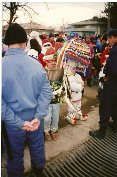
Fig.1 Mască modernă de cuc și alte personaje moderne (din arhiva personală de fotografii)

Vă prezentăm mai jos câteva fotografii realizate de autoare împreună cu o grupă de studenți într-o culegere de teren din 2006 în comuna Brănești.